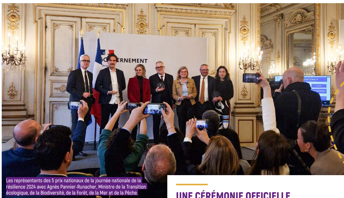
Les représentants des 5 prix nationaux de la journée nationale de la résilience 2024 avec Agnès Pannier-Runacher, Ministre de la Transition écologique, de la Biodiversité, de la Forêt, de la Mer et de la Pêche.

Le Résilience Tour 2024 a été distingué par un prix national à l'occasion de la cérémonie de remise des prix de la Journée nationale de la résilience , organisée au ministère de la Transition écologique, de la Biodiversité, de la Forêt, de la Mer et de la Pêche. Cette récompense met en lumière l'engagement de l'Association Française pour la Prévention des Catastrophes Naturelles et Technologiques (AFPCNT) et de l'Institut des Risques Majeurs (IRMa), co-réceptaires du prix, pour leur contribution active à la diffusion de la culture du risque sur le territoire français.