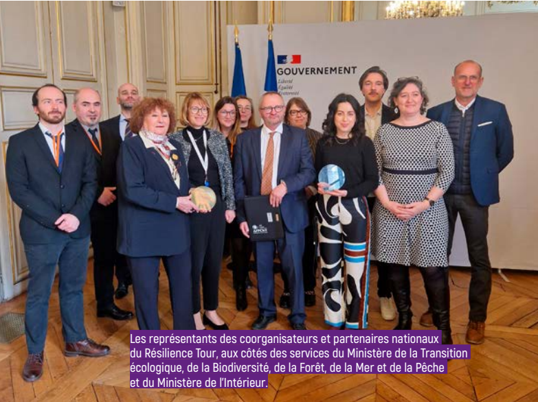
Les représentants des coorganisateur et partenaires nationaux du Résilience Tour, aux côtés des services du Ministère de la Transition écologique, de la Biodiversité, de la Forêt, de la Mer et de la Pêche et du Ministère de l'Intérieur.

Pour la troisième année consécutive, le Résilience Tour a été récompensé pour son implication dans la sensibilisation des citoyens et des acteurs locaux aux risques majeurs par Agnès PANNIER-RUNACHER, ministre de la Transition écologique, de la Biodiversité, de la Forêt, de la Mer et de la Pêche.